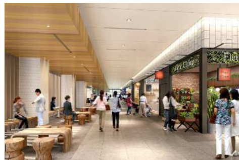
KITTE名古屋1階（イメージ）

オフィスワーカーにとっての利便性を意識しながらも、バスターミナル乗車口の店舗エリアとして、家路に就く人たちのつかの間の休憩時間に対応し、ちょっとした自分へのご褒美やお土産等で気分を盛り上げてくれる場所となります。