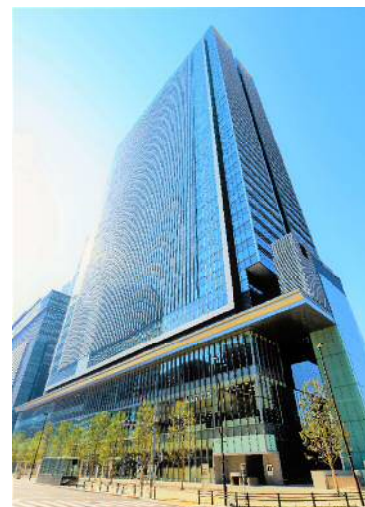
JP TOWER NAGOYA