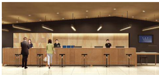
名駅サテライトクリニック（イメージ）

さらに、女性のお客さまには女性専用の診療エリアを設け、女性のためのスタッフによるきめ細かな医療サービスと心温まる空間をご用意するほか、海外からのお客さまのニーズにお応えする一端を担うため、医療ツーリズムとしての健診、各種人間ドック、アンチエイジングドックを提供するなど、総合健診センターを通じて皆さまの健康と医療の発展への貢献に取り組みます。